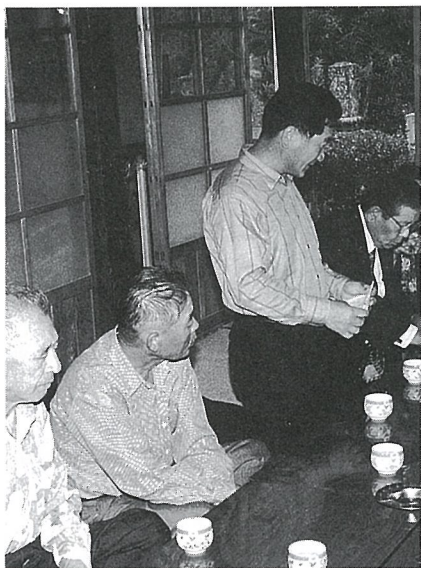
集落の要望を発表するみなさん

また、整備をする場合には、（注1）請負工事で行う場合と（注2）資材交付をし、集落で工事を行う方法とがあります。いずれの