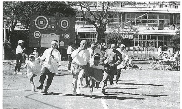
▲2人の息を合わせて、スタート！