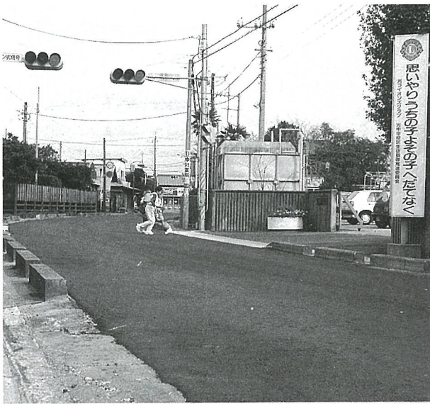
県道拡幅補償工を行う白浜小学校門付近

排水機場の設置を県営事業により行っています。町はこの事業費の5%を負担することとなり、当初予算で750万円を計上したところですが、事業費が増額になったことに伴い、不足が生じたことから550万円を増額しました。 ● 県営かんがい排水事業 (小川台地区・橋場地区) 負担金 総事業費1億4840万円 円の一部を負担