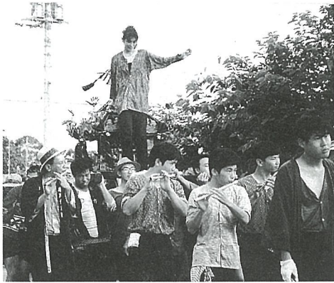
7/29・30 はしば夏まつり

ちょうちんの下では、ゆかた姿の老若男女が踊りの輪を作ります。ふるさとを離れていた人たちも集り、人々のふれあいが生まれ、夏の夜のひとときが過ぎていきました。