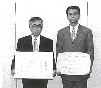
▶喜びの熱田校長(右)と伊橋PTA会長(左)

5年の2か年間、学校安全研究指定校に指定され、以来全校一丸となつて安全教育に打ち込み、その実践活動が認められ、昨年の文部大臣賞に引き続き、小学校では全国唯一、内閣総理大臣賞を受賞しました。