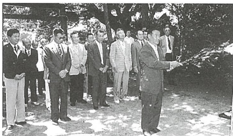
厳かに式が行われた