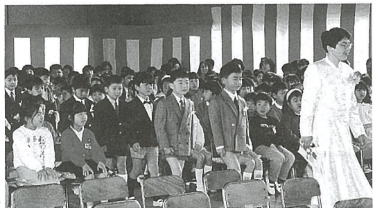
緊張したおももちで入場する新入生

担任の先生の後に続き入場した新入生はちよっぴり緊張の顔が伺えましたが、先生から名前を呼ばれると大きな声で元気な返事がか