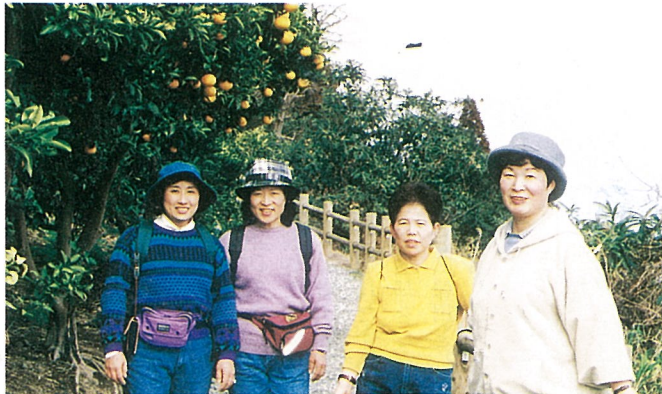
▲ 天候・景色に恵まれ、参加者は大喜び

暖かい春の日差しを受けて、2月26日～27日静岡県由比町・清水市を舞台に駿河路ハイキングが行われました。心配されていた前日から雪もやみ、薩埵峠から眺める駿河湾やたくさんの実をつけたみかん畑の中で参加者26人は大喜び、足取りも軽く約7kmを1時間半で完歩しました。翌日は隠れていた富士山も顔を出し、絵に書いた様なすばらしい景色の中で楽しい思い出を作りました。 白浜小学校6年生がすし作りに挑戦。以外や以外、男の子が意欲的に取り組んでいました。巻いたすしをのぞきこみながら慎重に包丁を入れる子供たちの顔を見て、思わずほえんてしまった。男の子にとっては、最初で最後のすし作りにならないように。「男子厨房に入らず」とは言うが、現在では過去の言葉？男女平等が叫ばれる昨今、何でもできて損はないと思う。プロは、全てとは言わないが、大半男の人ですよね。 (師岡)