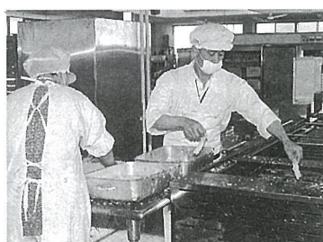
手作りのおいしい給食

昭和54年に建設された給食センターでは、小中学校の学校給食を作っています。食品をあつかっているため衛生面には特に気をつかい、古くなった備品などは計画性をもって買い替えを行っています。今年度調理場の床改修工事を夏休みを利用して実施します。