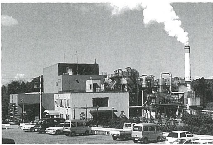
ゴミの収集、焼却をする環境衛生組合