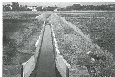
素掘りの排水路に柵渠を設置