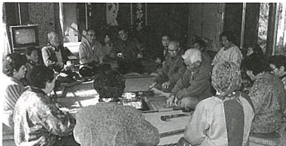
▲鉦の音が響くなか行われました

慶応2年から続いている傍小戸区の宗教行事である百万偏が区の青年館で2月8日に行われ、集った17人のお年寄りは輪になり、長さ10m程の大きな数珠を、「なんまいだ、なんまいだ」と唱えながら回しました。この日に作られたへい束は、集落の境にたてられ、お札は家庭にいただいで帰りました。 通信員 齊藤しげ子 (傍小戸)