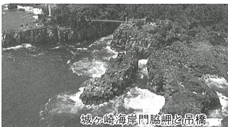
城ヶ崎海岸門脇岬と吊橋

期日 2月27日(日)～28日(月) 場所 静岡県伊豆市城ヶ崎 対象者 体力に自信のある方 人員 30人(多数の場合は抽選) 参加費 1万2千円 期限 2月15日(火) 申込み 町民会館