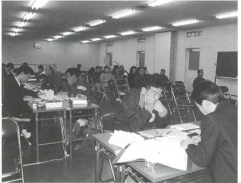
▲ 期限間際になりますと大変混雑します

税金は、みなさんが安心して生活していくための、道路・教育・警察・消防などの公共サービスに使われます。この税金の基になる申告時期を迎え、申告にあたっての改正、注意点を紹介します。