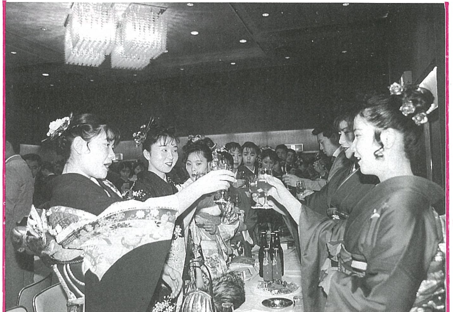
▲ ワイングラスを傾け、乾一杯!

⊗式に臨みざわめきが目立ったので、けじめが必要ではないかと感じました。 昨年選挙も経験していますし、既に社会に出ていますので今特に感じることはありません。