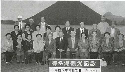
榛名湖観光記念 平成5年10月20日 6 湖味香

老人クラブのみなさんは、バスの中や寝て歌や踊りにハツスルして和気あいあいの賑やかな旅となりました。