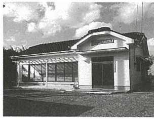
▲ おだれ五区ふれあい館

地域住民のコミュニティ拠点として、県コミュニティ育成事業と町集会所設置事業補助を活用し、地元関係者の努力により、「おだれ五区ふれあい館」が7月30日、「西高野共同館」が11月28日に完成しました。