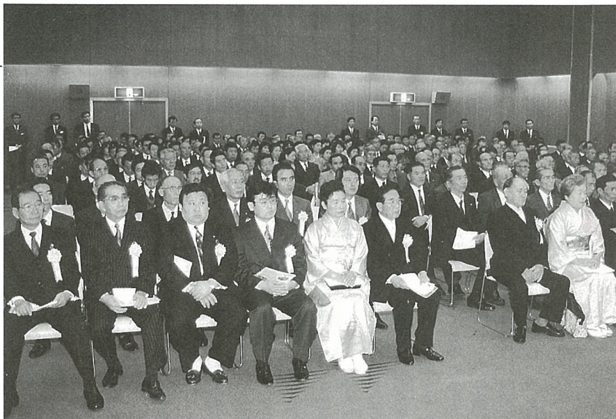
毎年御用始めの日に行われる新春パーティー（昨年の新春パーティーから）

町の「平成6年表彰の受彰者」が決定しました。この表彰は、長年にわたり町内の各分野で地道な活動を続け、町の発展のために貢献されてきた方々の功労をたたえるもので、今年も自治功労6人、教育功労9人、産業功労3人、統計功労1人、消防功労2人、防犯功労1人、交通防犯功労1人、社会福祉功労1団体、納税功労1団体の9分野にわたる23個人と2団体を表彰します。また、篤志寄付をされた1社1個人については感謝状を贈ります。 (受彰者のみなさんは次のとおりです。)