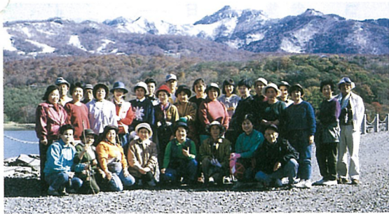
▲ 思わぬ積雪に参加者は大喜び