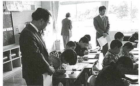
◀「先生方が見ている緊張しちゃった!」

平成4年度・5年度と千葉県教育委員会と町教育委員会から学校安全の指定を受けた日吉小学校で、10月15日に研究会が行われました。この日は、「1人1人の