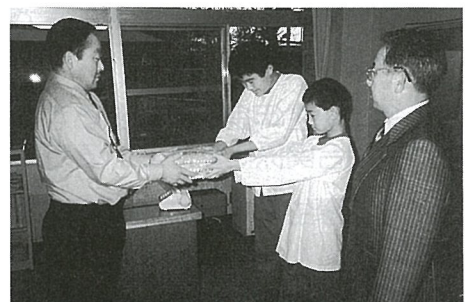
◀児童に豚肉を贈る信田会長

翌日行われた生産体験学習の成果を発表する落葉焼集会でトン汁や焼肉でおいしく頂きました。