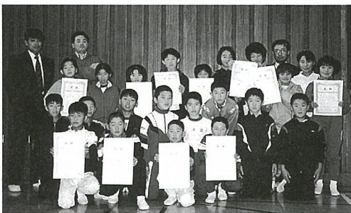
▲ 総合2位に輝いた東陽小学校