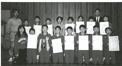
◀総合3位の日吉小学校