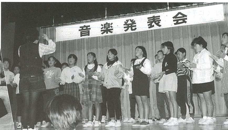
▲混声合唱 会場いっばいに子供たちの歌声が響きます (日吉小学校)