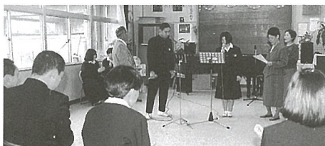
▲カラオケ教室 光音頭を熱唱