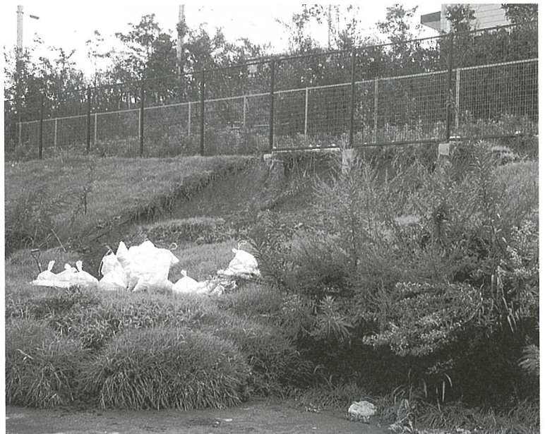
台風11号で被害を受けた光スポーツ公園（写真上） しあわせ基金の利子を活用して行った「いきいき運動会」（写真下）