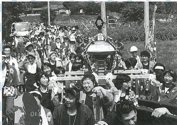
▼ 女みこしは、華やかさいっぱい