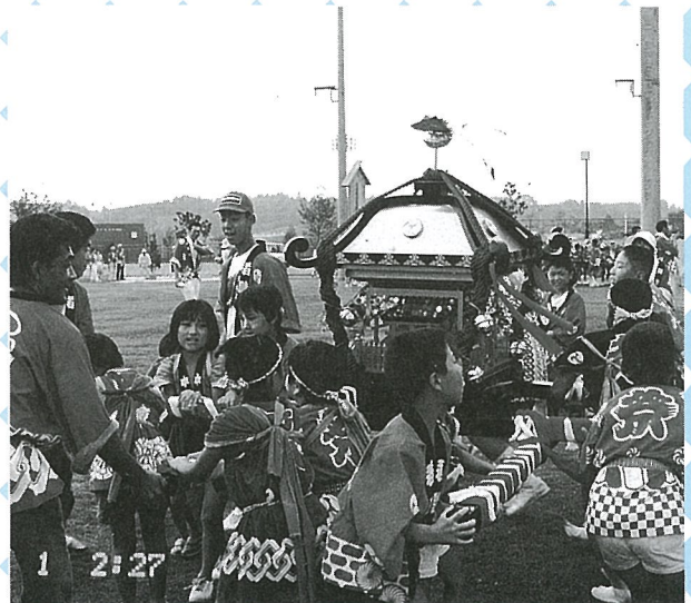
▼ 最終、力をふりしほってみこしを踊らせます