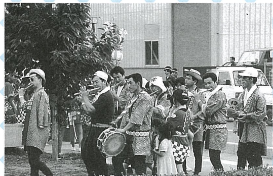
▲ 宝米はやし連、いよいよメイン会場へと