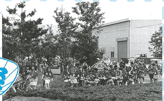
▲ 続々と光スポーツ公園にみこしが集合