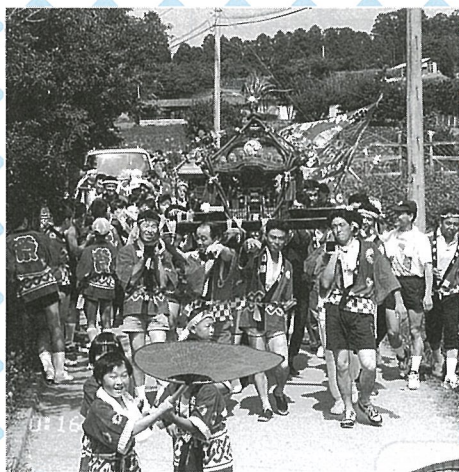
▶ 長く、賑やかなみこし行列