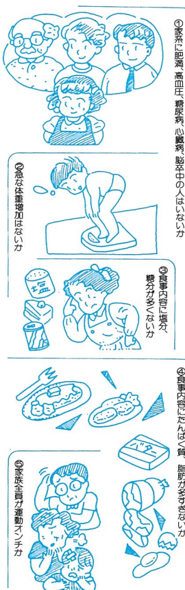
① 緊に肥満 高血圧 糖尿病 心臓病 脳卒中の人は少ない

股ずれ ● ● ● わきの下、乳房の下、内股などがこすれやすく、こすれた所が赤くはれ、そこに細菌がつかると、おできになりますので注意を。