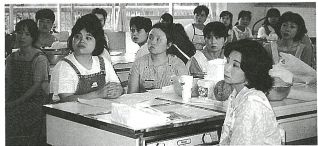
▶ 検診結果を聞きいるお母さん(日吉小)

します。医療費は、入院、通院、歯科、調剤、コルセットの作製料と看護料などがあります。このほかに、高額療養費として5549万円を支払いました。