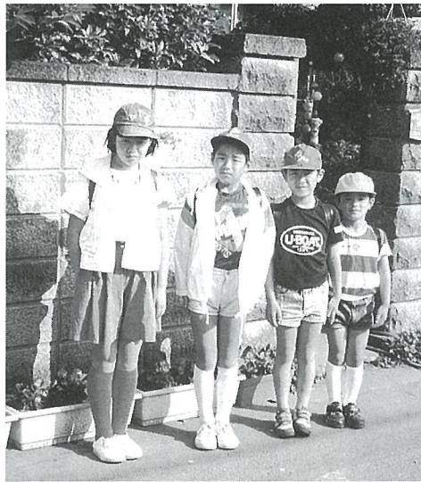
今年は、4人の兄弟が全員小学校に通っています

始め子供たちをおいて家を開けることが多くなり子供の世話もままならぬ中、わが家の梶取りである主人にしっかりと寄り添い気持ちをもひとつにすればと信じてきました。子供たち、主人の友達、私の友人の出入りの多いこと