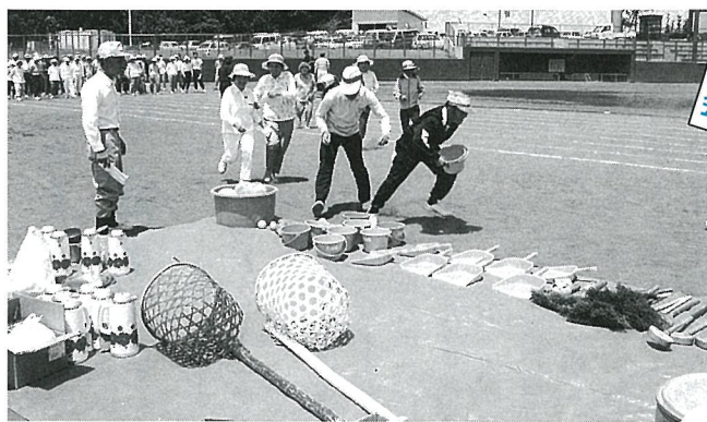
▲ 熱気あふれる大会になりました