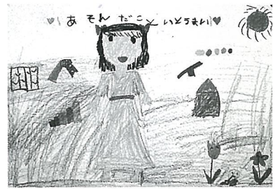
『楽しかった成田ゆめ牧場』

※社会科見学で成 田ゆめ牧場に行 きました。お弁 当を食べたり遊 んだりとても楽 しかったです。