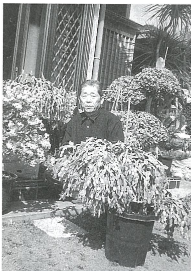
▲春の日差しを受け、美事に開花しました

の団扇サボテンを台木にシヤコサボテンの接木に成功して毎年美事な花を咲かせ来客の目を楽しませている。通信員 伊藤定男(尾垂五区)