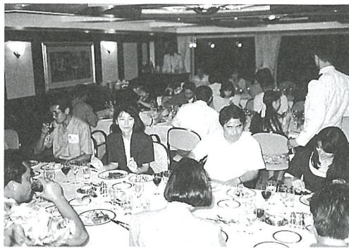
▶食事をしながらの楽しい語らい(昨年のクルージング)

らしい出会いとなる催しを計画しましたので積極的に参加してください。 また、クラブ入会はいつでも受け付けています。 ○仲人慰労金3万円を支給 未婚者の出会いから結婚まで、その仲を取り持ち、親身に結婚の成立に貢献された方に対して仲人慰労金を支給します。なお、結婚当事者が当町に居住することが条件です。