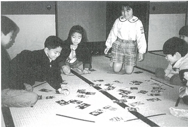
▲ 子どもたちは、真剣そのもの。

学校の休業土曜日である3月13日に、町民会館で小学生150人が参加したかるた大会が開かれました。 光町カルタの普及と親睦のために行われているこの大会も今年で3回目です。学年毎に4・5人でグループを作って競技が行われました。子供たちに親しまれているだけにお手つきも少なく、すばやく取るため一枚一枚読みあげられるたびに大きな歓声が会場いっばいに響いていました。 光町カルタは、教育委員会で販売しています。低・高学年ともに1750円です。