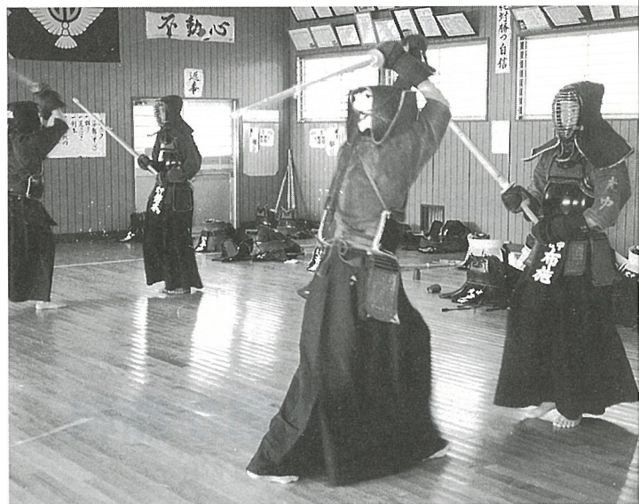
▲ 選択科目がふえた中学生

平成元年度から近隣市町に先がけて導入したコンピュータ教育は、技術科の授業の中で情報基礎学習として位置づけられています。