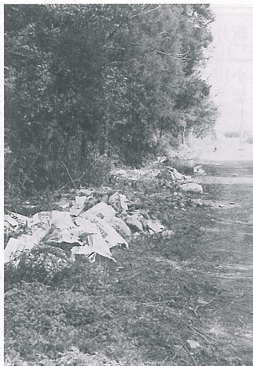
投げ捨てられたゴミ

ゴミの減量化対策として町では生ゴミや可燃ゴミの焼却炉の購入について補助をしていますが、5年度はボランティアによる環境美化奉仕活動を積極的に支援するための経費522万円を計上しました。