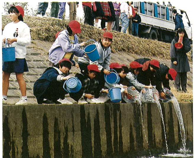
▲ サケの稚魚を放流する白浜小5年生