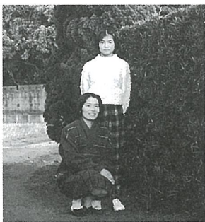
▲4月には6年生になる二女と

末の子という事で親の扱いは緩んでしまったのですが、長女と長男が仕立役になってくれた二女は、4月には6年生。もう母親の背丈を越したのですが、姉や兄に使い走りを強いられてしま