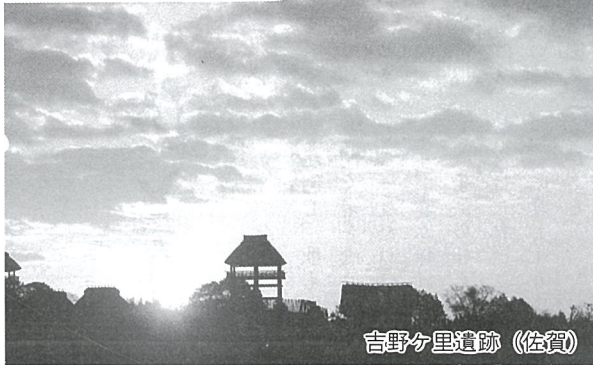
吉野ヶ里遺跡 (佐賀)

町民のみなさんにご好評をいただいている「元気アップ町民空の旅」は、海がきらめき異国情緒あふれる歴史とロマンのふるさと、西九州を計画しました。