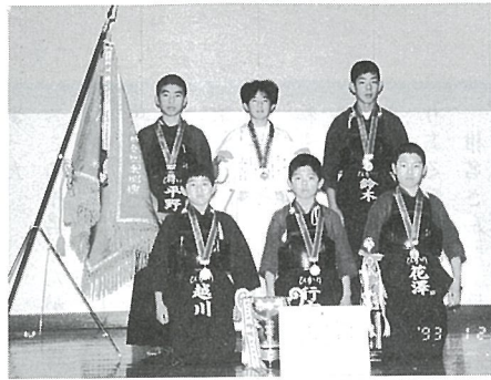
▲堂々の2連覇を遂げた日吉スポーツ少年団