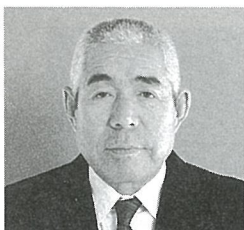
磯 後 和 夫 氏 白 向