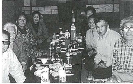
▲この席上で次期清掃日も決まりました

「昔は暇がなかったが、今は余裕ができたので」と五ノ神の老人クラブの8人が、集落内の缶拾いと集落センター周辺の草刈りを10月16日に行いました。終了後のお茶飲み話では、「きれいになって気持ちがよい」と話もでて、毎月1日と15日の清掃日も決まりました。