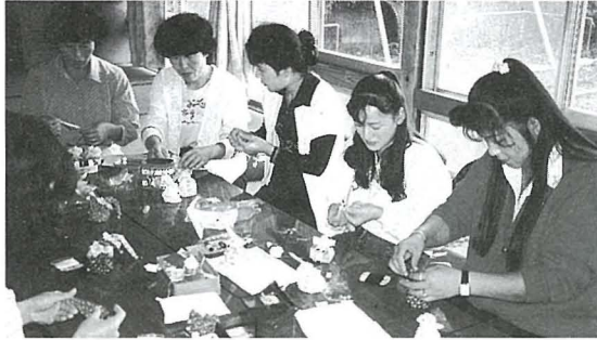
▶家事を忘れての楽しい人形作り