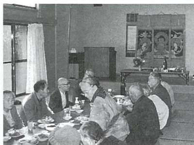
▶三区の親交を深めました

貝塚(八日市場)・台・小田部のお年寄りが集まり「三ヶ村念仏経文」を合唱する念仏講が、10月22日に台青年館で行われました。あみだ様、観音様、地藏様の掛け軸を下げ、祖先の霊を弔います。途中止めたら、三ヶ村に不幸なことがあり再び始めたそうです。