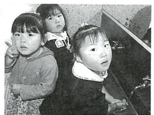
▲みんなであそぼうね

合。(父親がその仕事をしていて従業員のいる家庭は除きます。) 入所希望児童が定員を上まわる場合や、小学校入学前の児童が2人以上いる家庭の場合。 希望者は各保育所、役場住民福祉課に申請用紙を記入のうえ、役場住民福祉課福祉係へ申し込んでください。 なお、5月以降の入所希望児童の受け付けは随時行っています。