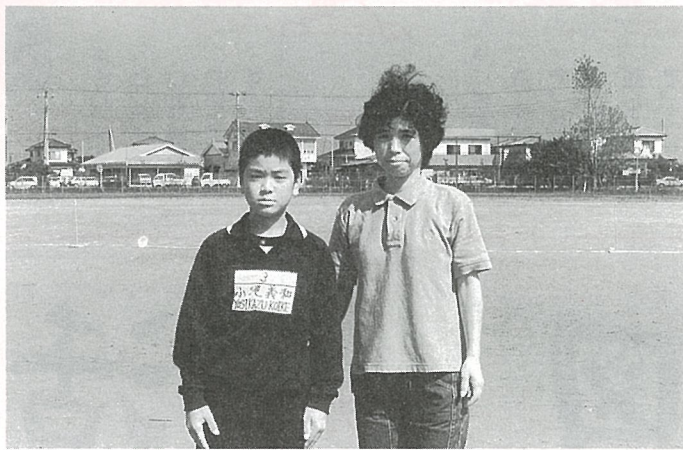
▲入院した時ほど、家族の思いやりを感じたことはありません。

これほど家族の思いやりを感じた事はありません。早いもので退院をしてから、もう6ヶ月にもなります。今はすっかり健康になり、仕事にも行ける様になりました。主人にも子供たちにも感謝の気持ちでいっぱいです。