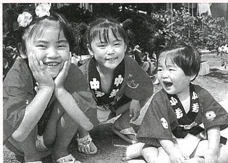
▲3人共、外で遊ぶのが大好き

遊んだ後は、「お母さん、おなかすいた、あやっ」と食欲旺盛です。育ちざかりなので、なるべく添加物の少ない食品を選び、手作りの物と心がけていますが、なかなかそうはいきません。辛い、子供たちはあまり好き嫌いがなく、何でもよく