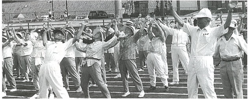
いきいき元気で明るい毎日が送れるように……

スポーツ文化基金 （補正額5、000万円） 今年3月に光スポーツ公園が完成しました。また今後、複合スポーツ施設や図書館の建設が予定されています。そこで、これらの施設に要