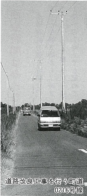
道路改良工事を行う町道0216号線