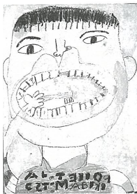
『きれいに、みがけたかな』

※顔の色塗りが濃くなったり、薄くなったり、大変でした。仕上がりが上手にできました。