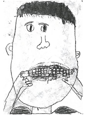
『とうもろこしをたべたよ』