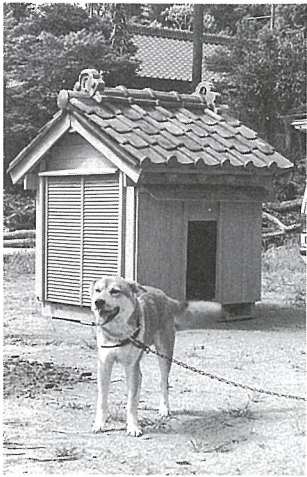
近所の人も立派さにビックリ