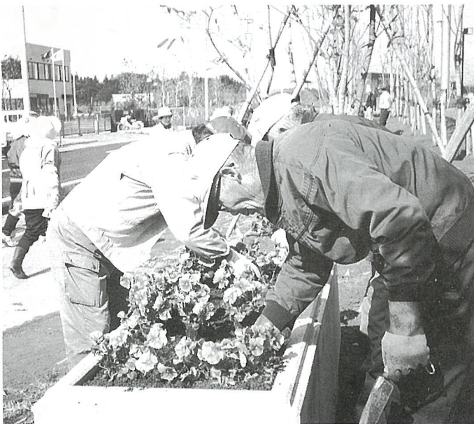
子供たちとグラウンドゴルフによる交流【写真右上】を行ったり、馬作りを伝承【写真右下】したり、花いっぱい運動【写真左】を元気に行う皆さん。