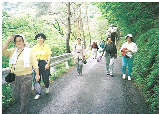
▲新緑を楽しみながらのウォーク