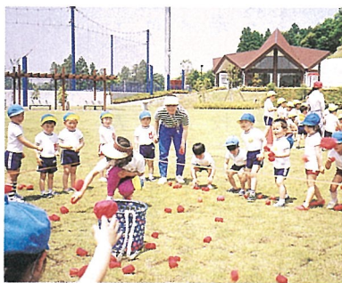
▲玉入れ ねらいを定めエイッ!