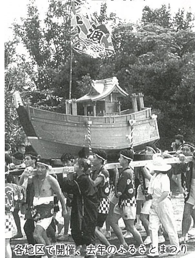
各地区で開催、去年のふるさとまつり