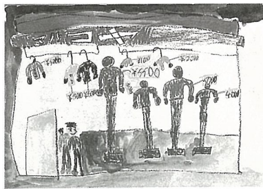
『おみせやさんの たんけんに行ったよ』