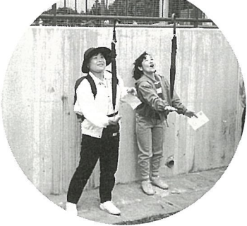
「傘を使つてのゲーム みんな無中」