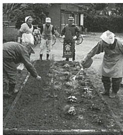
3月24日に作業が行われた

入老人クラブが青年館の花壇の手入れをして、各自持ち寄つた花の苗を植えました。 この日は、役員さん方により行われ、植えられた花々が青年館利用者の目を樂ませ喜ばれています。 通信員 川島 和(入)