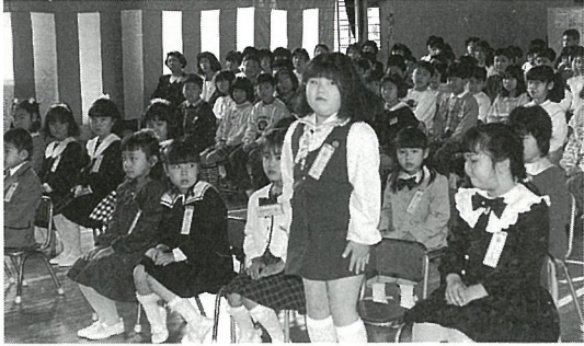
▲ 大きな声で「ハイ」と返事ができました