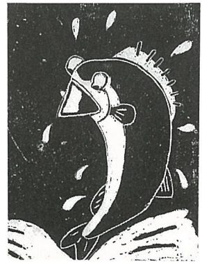
せっこう版画『さかな』

※魚の腹のこ ろを削るのが 大変でした。 インクのつき がよく、よく できました。