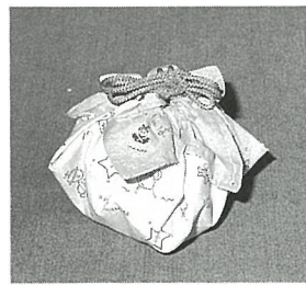
『おべんとうつつみ』