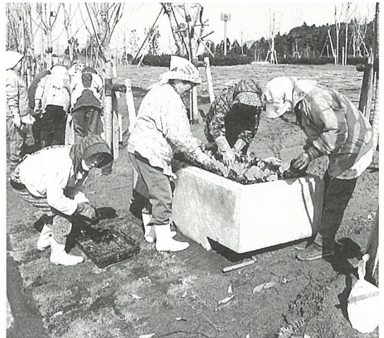
【写真上】光スポーツ公園で植栽を行う高齢者生きがい対策創生事業【写真下】親子で楽しく参加できるおやつづくり教室

し尿と生活雑排水(洗たくに使った水など)と一緒に浄化する合併浄化槽の設置に対する補助は、4年度は21基分を予定しています。(8人槽の浄化槽設置の場合は90万円を助成) 事業費 1,837万円