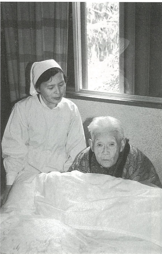
在宅福祉の充実に町は全力投球します