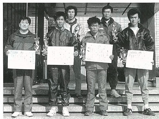
▲ 10・15・25回出場を果たした方がた