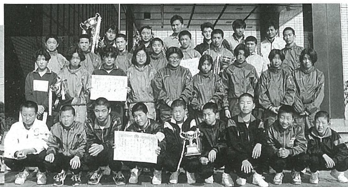
▲ 王座についたみなさん(優勝チーム)