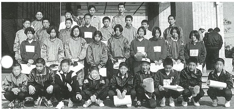
▲ 区間賞を手にしたランナーたち(区間新が続々)