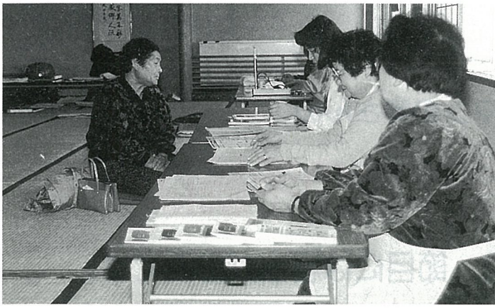
▲ 結果報告会では、健康管理へのアドバイスがありました