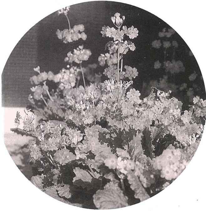
咲き出した「さくら草」

3月に卒業式を迎える6年生は、先生の指導でさくら草の苗をポットで育て、さらにプランターに移して会場を飾ります。